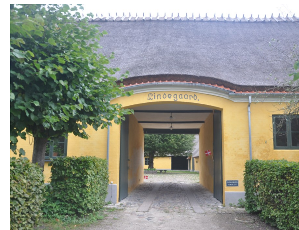
Lindegården, Bondebyen, Peter Lunds Vej, 1650, den sidste hele bygård i Lyngby.