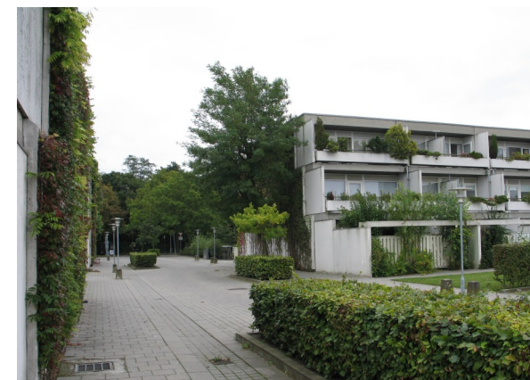
Eremitageparken, 1972, arkitekter Erik Kors-hagen og Jørgen Juul Møller.