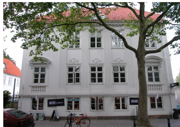
Det Hvide Palæ, Lyngby Hovedgade, 1806, opført til udlejning til sommergæster.

Se mere på foreningens hjemmeside www.bygningskultur-lt.dk og på www.byogland.dk