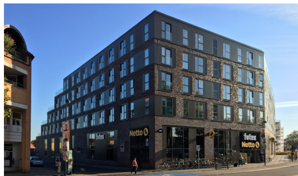
Lyngby Hovedgade, tidl. Andersen og Martini, 2020-21, arkitekt Arkitema Architects. Eksempel på nybyggeri hvor foreningen forgæves gjorde indsigelse mod bl.a. højde og bebyggelsesprocent.

Bygningskultur Foreningen i Lyngby-Taarbæk er tilsluttet Landsforeningen for Bygnings- og Landskabskultur. Dermed har foreningen mulighed for at rejse sager om bygningsfredning, ligesom den skal høres i en række frednings- og planlægnings-sager. F.eks. høres foreningen, før kommunen tager beslutning om nedrivning af en bevaringsværdig bygning.