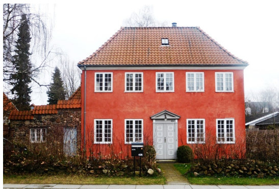
Caroline Amalie Vej 42B, 1916.

Som medlem vil du modtage bladet By og Land fire gange om året. Send os gerne din e-mailadresse, så du kan modtage nyheds- og medlemsbreve bl.a. med tilbud om arrangementer.