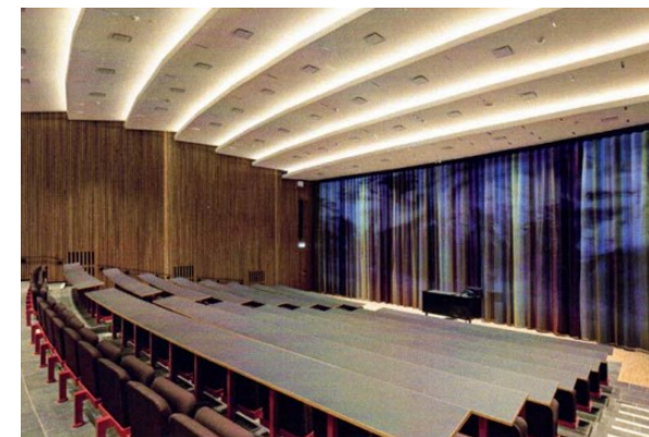
DTU, bygning 116, Rørbæk og Møller Arkitekter A/S, præmieret i 2023 i kategorien renovering.

I 2015 tog vi sammen med kommunen initiativ til at oprette en arkitekturpris. Prisen gives for både nybyggeri, renovering og ombygning. Prisen uddeles hvert fjerde år.