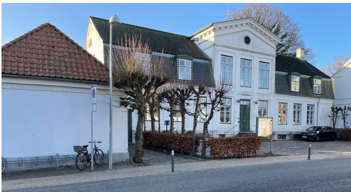
Lyngby-Taarbæk Kommunes første bibliotek lå i Gammel Rustenborg på Rustenborgvej 1.