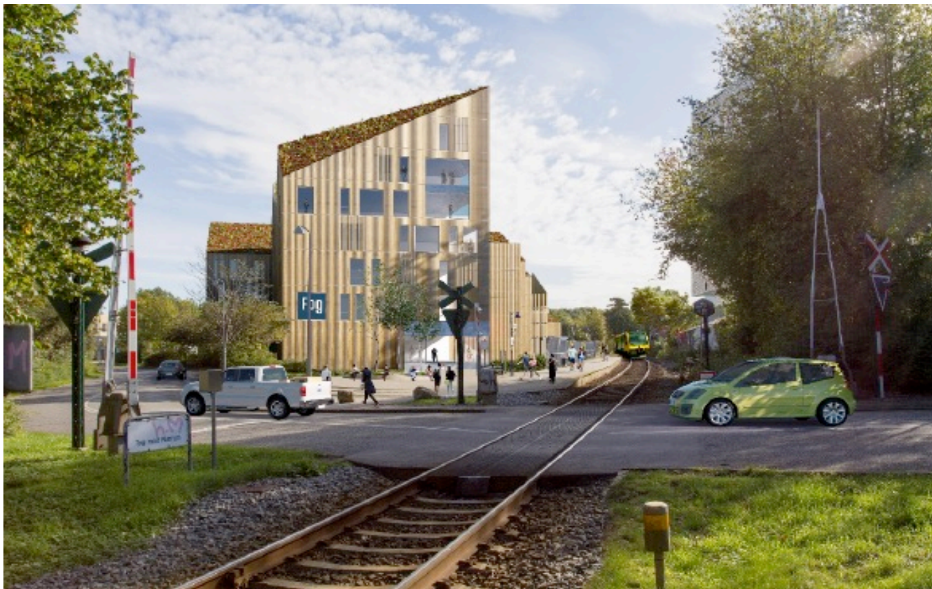
Eksempel på udformning af ny bebyggelse og bud på indretning af den nye stationsplads ved Nørgaardsvej Station. III. Ole Hagen arkitekter A/S

Bygningskultur Foreningens bestyrelse holder møde en gang om måneden. Også i år er der brugt kræfter på at prøve på at påvirke en række lokalplaner , dels ved deltagelse i borger-møder om forslagene, og især ved at udarbejde udtalelser.