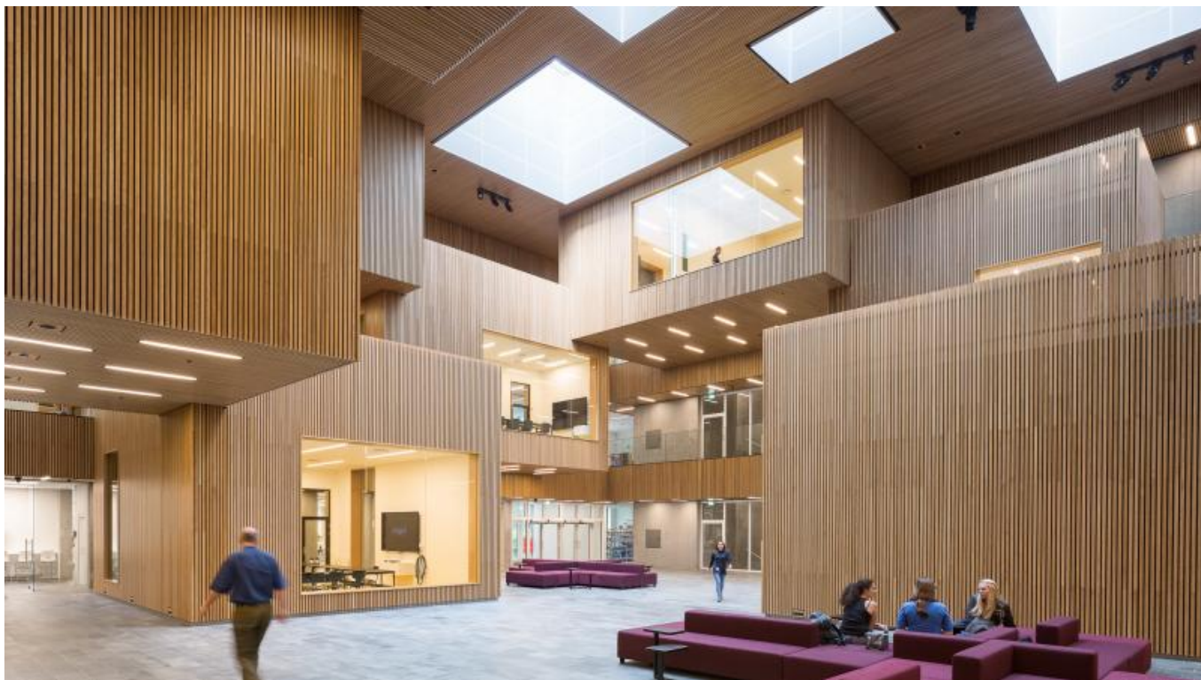
Interieur fra Bygning 202 på DTU, en af de bygninger der blev besøgt på foreningens rundtur.

- Besøg på virksomheden Aquaporin på Nymøllevej den 24. januar. Virksomheden har til huse i en ældre industribygning, der har gennemgået en meget fin renovering.