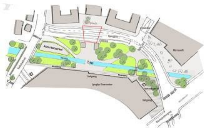
Bilag 8 Illustrationsplan: Delområde 4

Bestyrelsen fremkom med en række forslag specielt til konkretiseringer til sikring af de rekreative arealer og udformningen af de bygninger, der tillades opført i tilknytning til Fæstningskanalen.